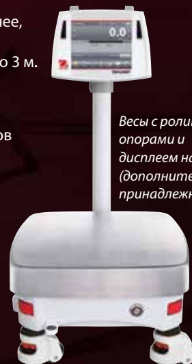
Весы с роликовыми опорами и дисплеем на стойке (дополнительные принадлежности)